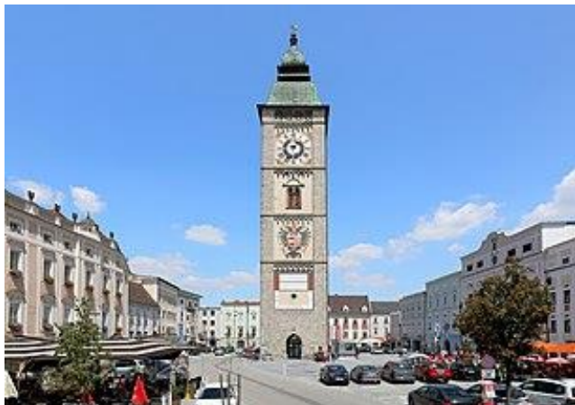
Enns an der Donau

Radstrecke: gesamt ca. 200 km, das Teilstück zwischen Hieflau und Reichraming auf einer Bundesstraße mit vielen Steigungen fahren wir mit dem Bus.