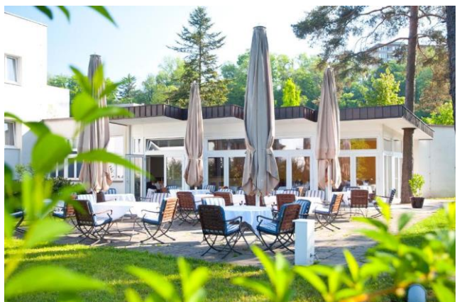
Parkhotel Styria, Steyr

Nach unserer ersten Übernachtung verladen wir unser Gepäck im Bus, satteln unsere Drahtesel und radeln weiter auf dem Enns-Radweg . In Liezen, Arding und Admont gibt es Möglichkeiten für eine gemütliche