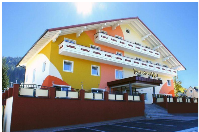
Hotel Tunzendorferwirt, Gröbming

Spätestens gegen 10.00 Uhr wollen wir in Flachauwinkl im Salzburger Land ankommen. Nach dem Ausladen unserer Fahrräder und einer angemessenen Frühstückspause werden wir unsere Radltour auf dem Enns-Radweg beginnen. Unser Gepäck können wir im Bus liegen lassen, da der Bus-