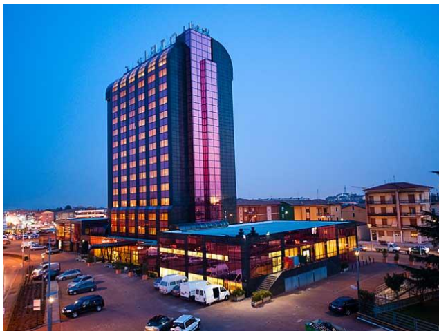
Hotel Tower, Bussolengo

Etwa 50 km sind am ersten Tag zu bewältigen, die Strecke geht am See entlang bis nach Bardolino . Hier verlassen wir den Lago di Garda und radeln weiter südostwärts nach Bussolengo an der Etsch zu unserem gebuchten Hotel Tower, **** .