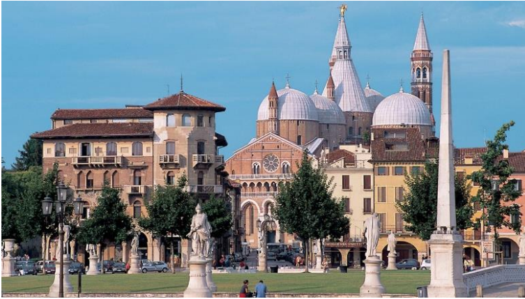
Padua mit Basilika

Die 3. Etappe führt uns zuerst durch die traumhafte Landschaft Norditaliens nach Vicenza und am Nachmittag weiter nach Padua . Beide Städte bieten ein einzigartiges Flair.