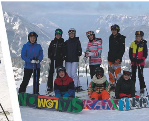
Bilder vom Ski- und Snowboardwochenende 2018