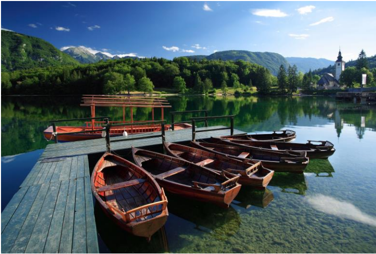
Wocheiner See (Bohinjsko jezero)

bis Bohinjska Bistrica . Nach einer Brettljause in einem urigen Gasthaus geht's mit dem Bus zurück zu unserem Hotel in Kranjska Gora. Heutige Strecke: ca. 60 km