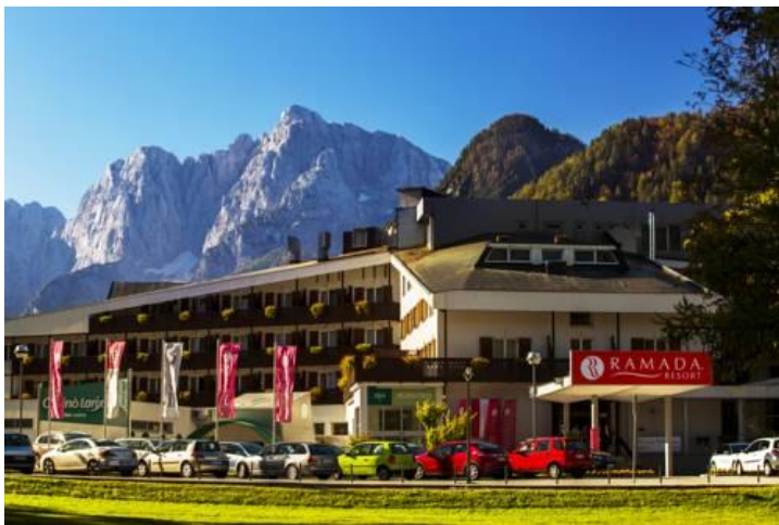
Hotel Ramada Resort, Kranjska Gora

Etwa 50 km sind am ersten Tag zu bewältigen, den längsten Teil der Strecke fahren wir auf dem Alpe Adria Radweg . Der Radweg führt uns über Arnoldstein nach Tarvisio in Italien. Hier verlassen wir den Alpe Adria Radweg und radeln weiter zu unserem gebuchten Hotel Ramada Resort in Kranjska Gora in Slowenien.